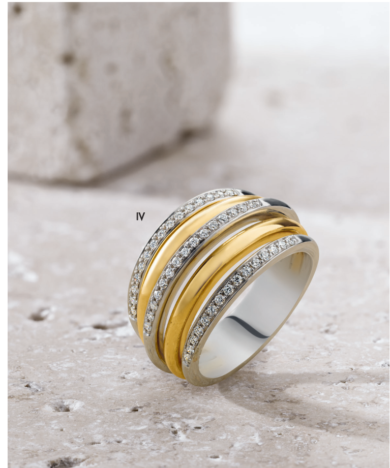
IV. Bague - Diamants, or jaune, or blanc - 2 700 €