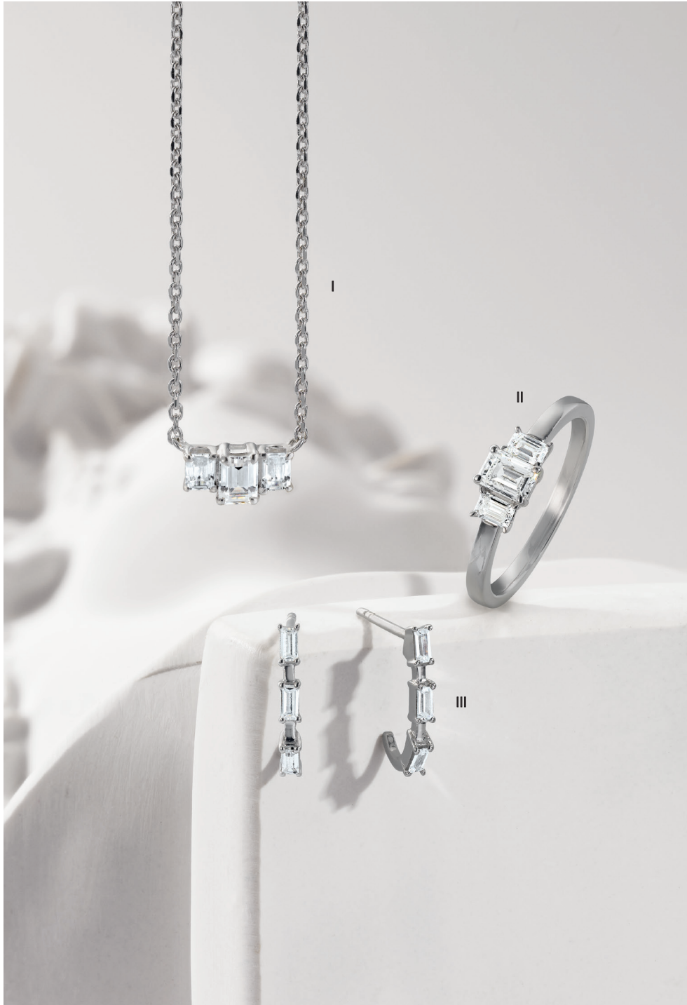
I. Collier - Diamants, or blanc - 3 650 € / II. Bague - Diamants, or blanc- 3 790 € III. Boucles d'oreilles - Diamants baguettes, or blanc- 1 095 €