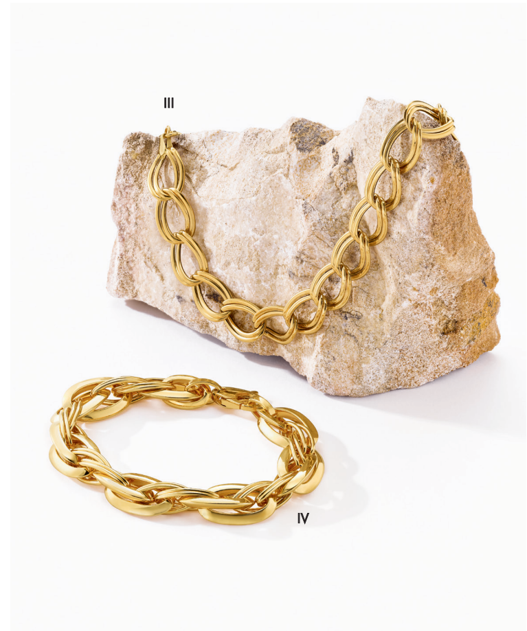
III. Bracelet - Or jaune - 860 €- Existe en collier / IV. Bracelet - Or jaune- 2 280 €