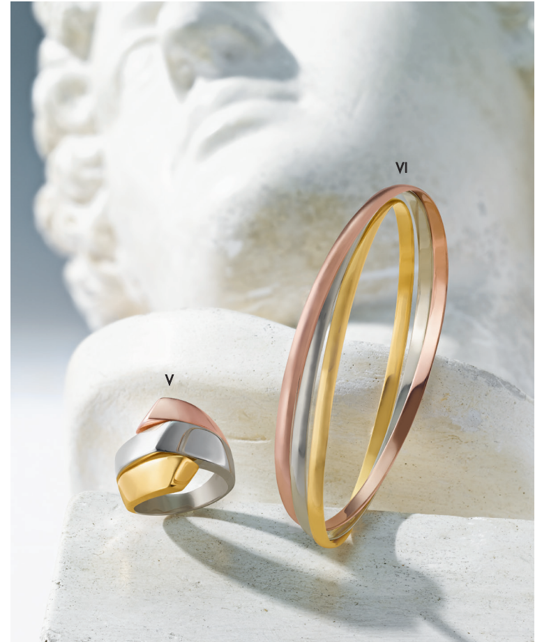
V. Bague - Or jaune, or blanc, or rose - 1 450 € / VI. Bracelet joncs entrelacés - Or jaune, or blanc, or rose - 2 920 €