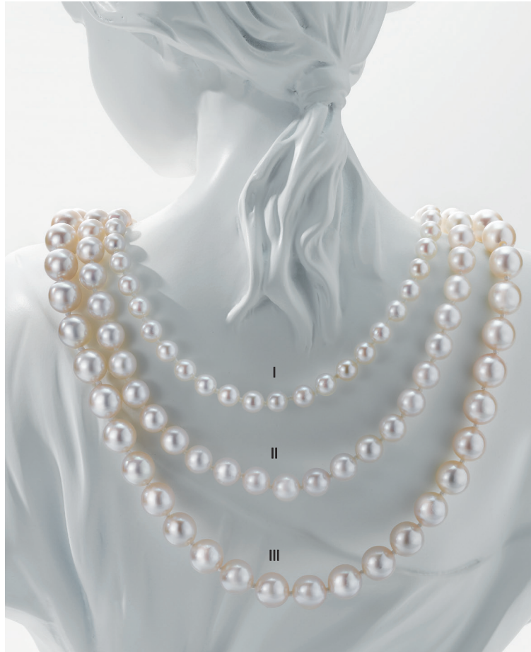
I. Collier - Perles de culture Akoya, fermoir or jaune - 995 € / II. Collier - Perles de culture Akoya, fermoir or jaune - 1 680 € III. Collier - Perles de culture Akoya, fermoir or jaune - 2 870 €