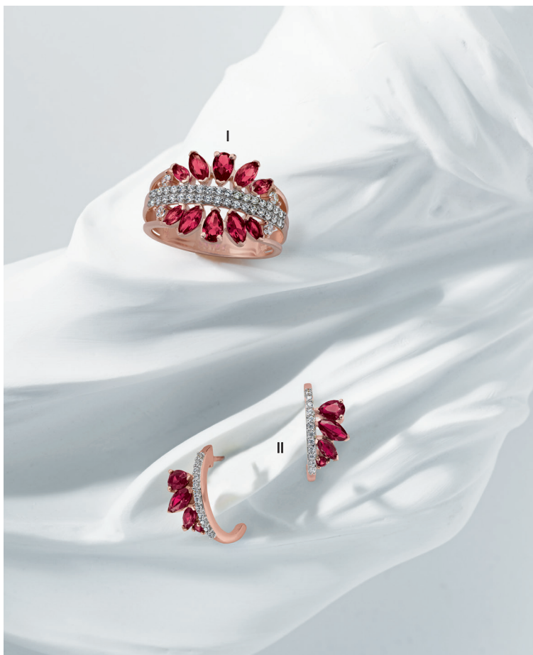
I. Bague - Diamants, rubis, or rose - 3 600 € / II. Boucles d'oreilles - Diamants, rubis, or rose - 1 500 €