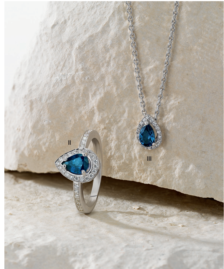
II. Bague - Diamants, saphir, or blanc - 2 530 € / III. Collier - Diamants, saphir, or blanc - 1 350 €