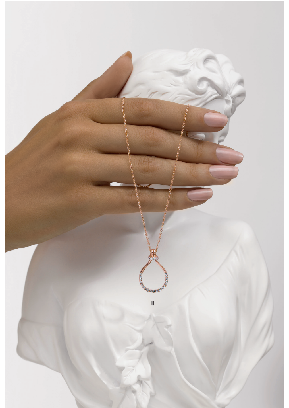
III. Collier - Diamants, or rose - 2 790 €