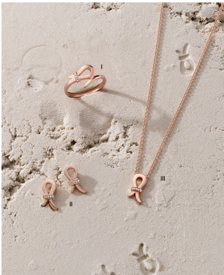
I. Bague - Diamants, or rose - 570 €/ II. Boucles d'oreilles - Diamants, or rose - 820 € III. Collier - Diamants, or rose - 730 €