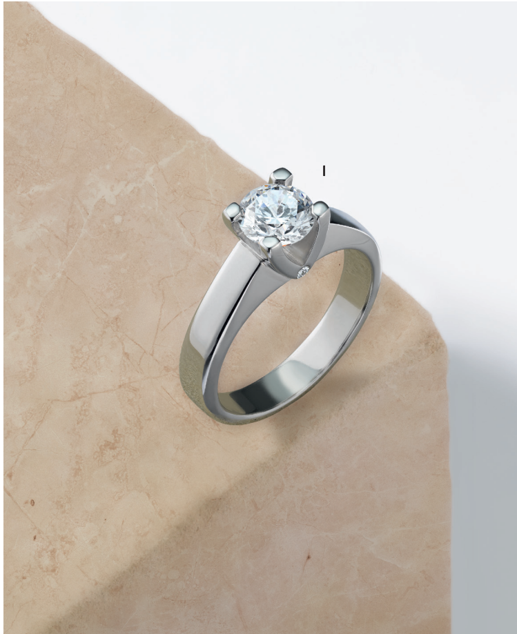
Ligne «Perspectives» en exclusivité pour Le Bijoutier des Créateurs I. Solitaire - Diamant, 1,00 carat, or blanc - Prix sur demande