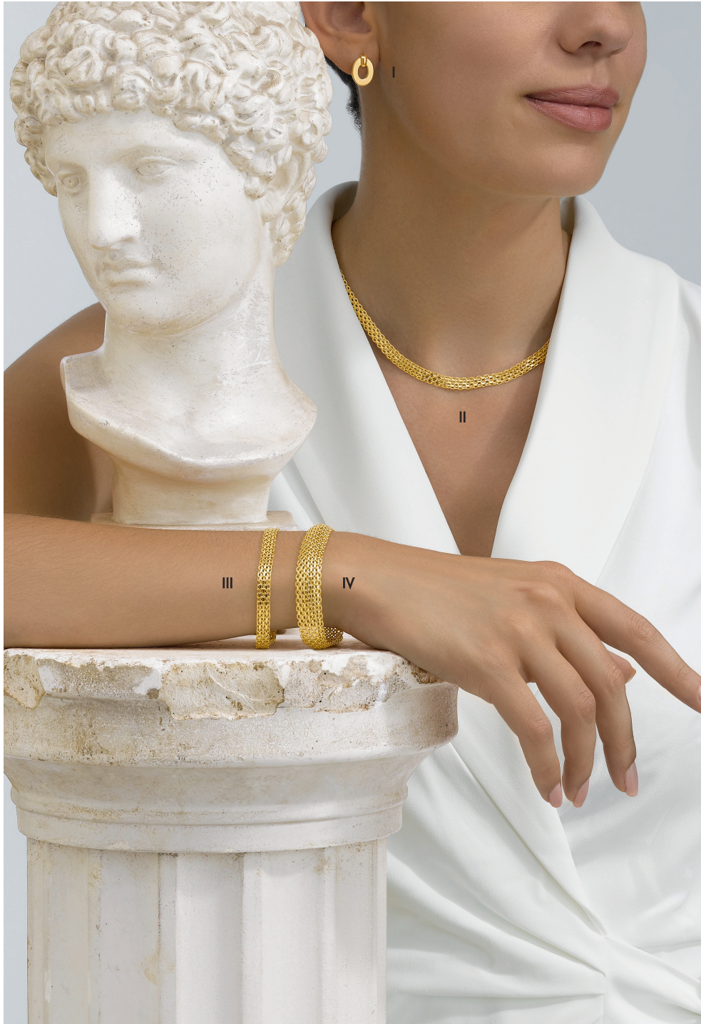
I. Boucles d'oreilles - Or jaune - 890 € / II. Collier - Or jaune - 1 595 € III. Bracelet - Or jaune - 790 € / IV. Bracelet - Or jaune - 1 630 €