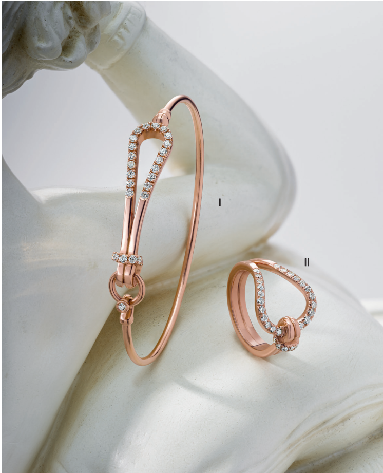
I. Bracelet - Diamants, or rose - 4 195 € / II. Bague - Diamants, or rose - 3 520 €