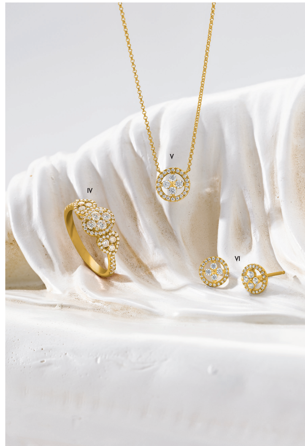
IV. Bague Vendôme Paris - Diamants, or jaune - 3 230 € V. Collier - Diamants, or jaune - 1 380 € / VI. Boucles d'oreilles - Diamants, or jaune - 1 350 €