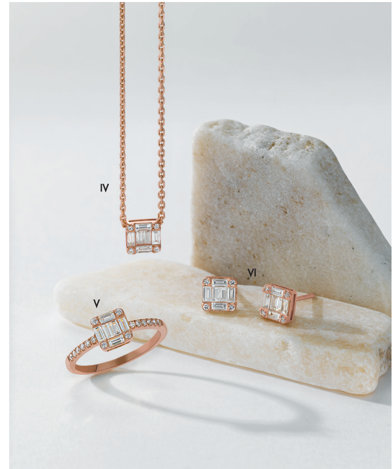
IV. Collier - Diamants, or rose - 1 840 € / V. Bague - Diamants, or rose - 1 830 € VI. Boucles d'oreilles - Diamants, or rose - 2 030 €