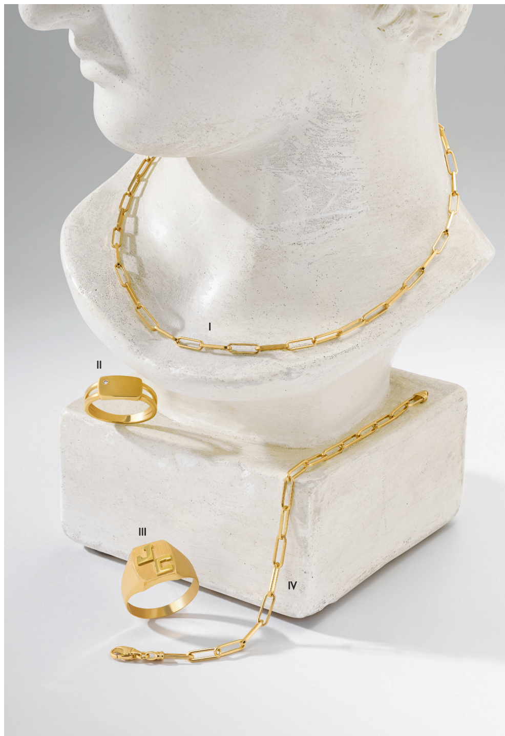
I. Collier - Or jaune - 1 750 € / II. Bague - Diamant, or jaune - 895 € III. Bague - Or jaune - 995 € / IV. Bracelet - Or jaune - 1 150 €