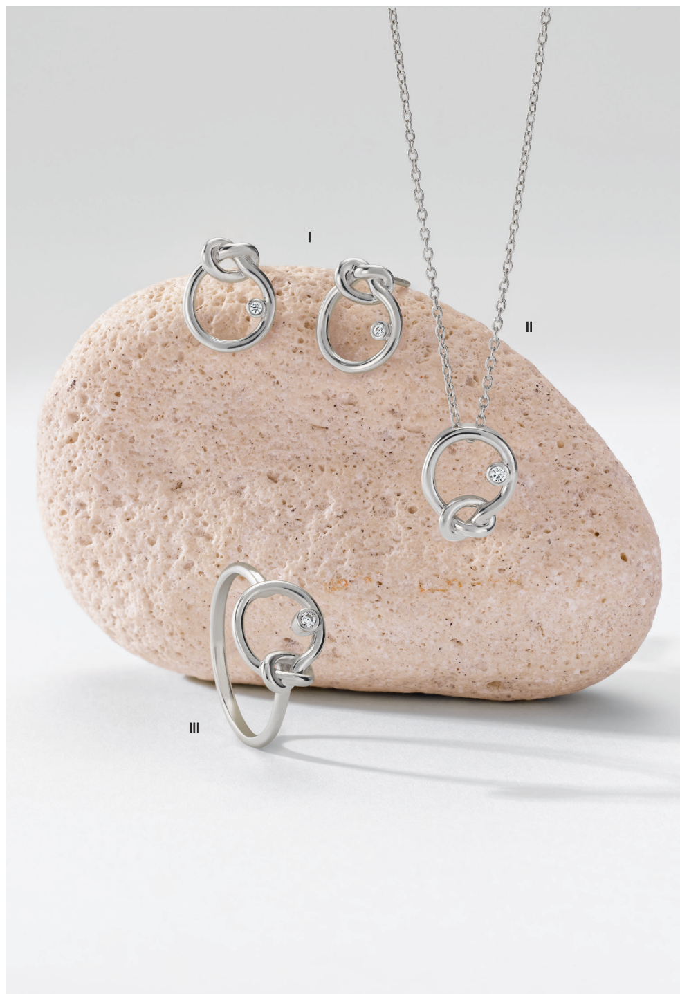
I. Boucles d'oreilles - Diamants, or blanc - 1 175 € / II. Collier - Diamant, or blanc - 1 420 € III. Bague - Diamant, or blanc - 1 090 €