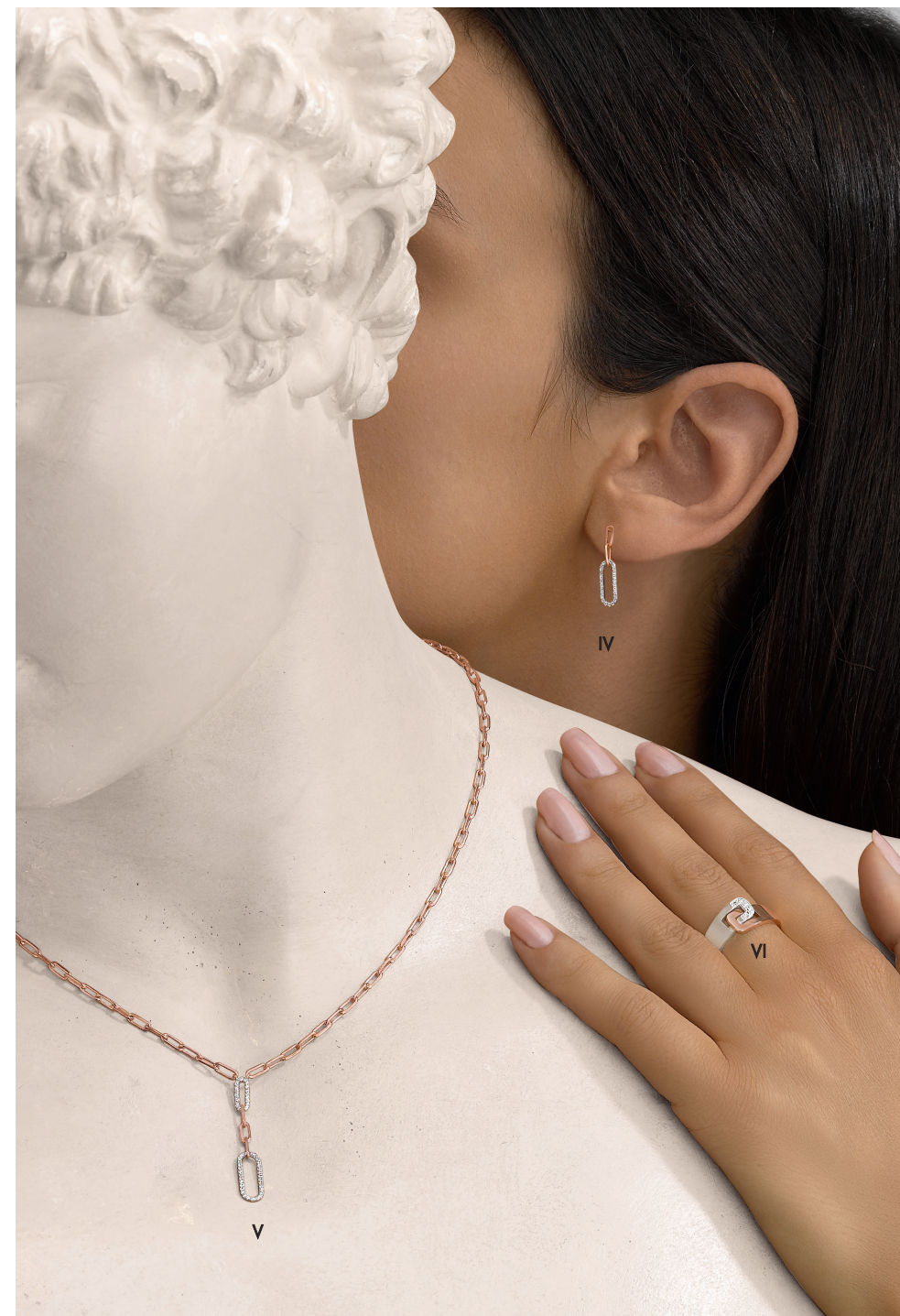
IV. Boucles d'oreilles - Diamants, or rose - 995 €/ V. Collier - Diamants, or rose - 1 790 € VI. Bague Clozeau - Diamants, or blanc, or rose - 1 280 €