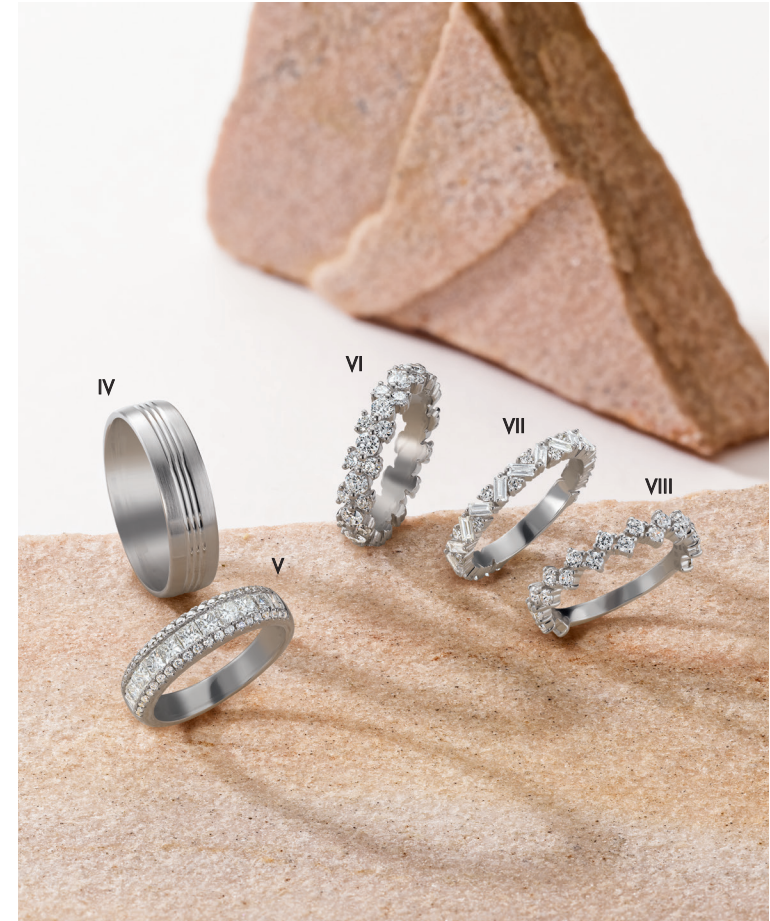
IV. Alliance - Or blanc - 1 100 € / V. Alliance - Diamants, or blanc - 4 350 € VI. Alliance - Diamants, or blanc - 5 500 € / VII. Alliance - Diamants, or blanc - 2 790 € / VIII. Alliance - Diamants, or blanc - 3 540 €