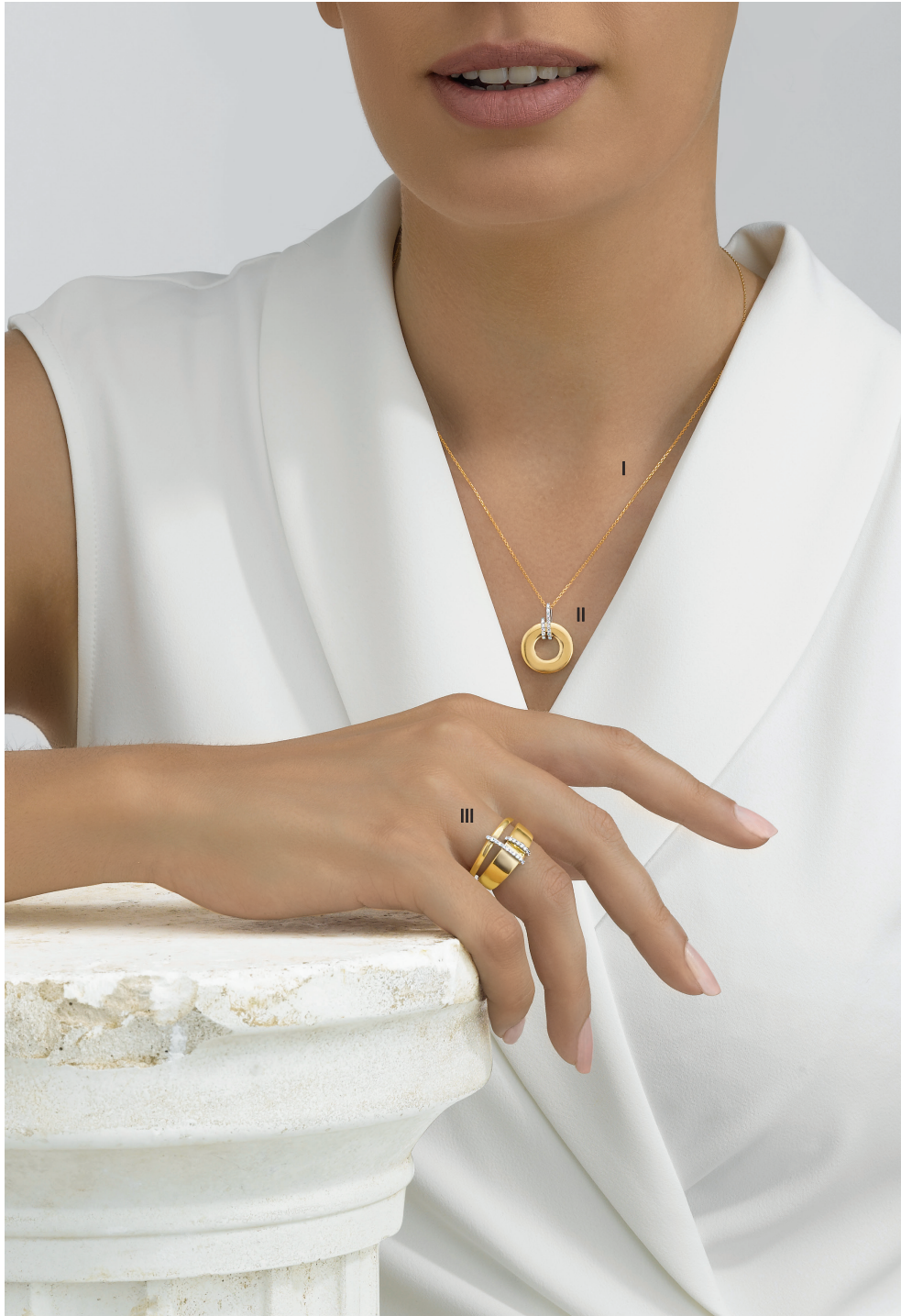
I. Chaîne forçat - Or jaune - 250 € / II. Pendentif seul - Diamants, or jaune - 1 475 € III. Bague - Diamants, or jaune - 3 050 €