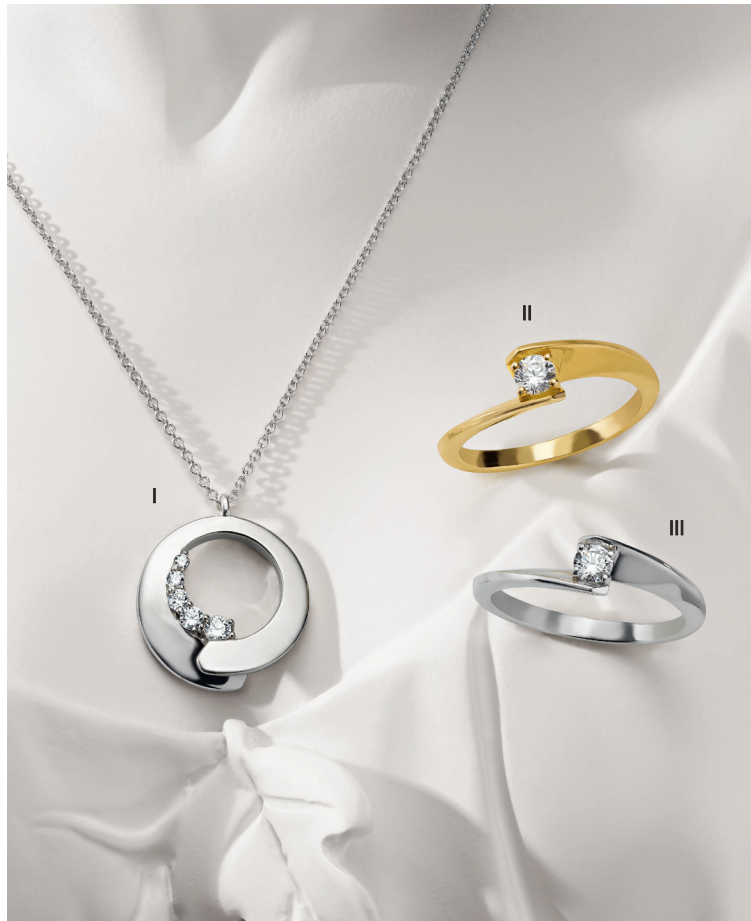
Gareil Paris - Ligne « Envol » I. Collier - Diamants, or blanc - 1 850 € / II. Bague - Diamant, or jaune - 1 790 € III. Bague - Diamant, or blanc - 1 450 €