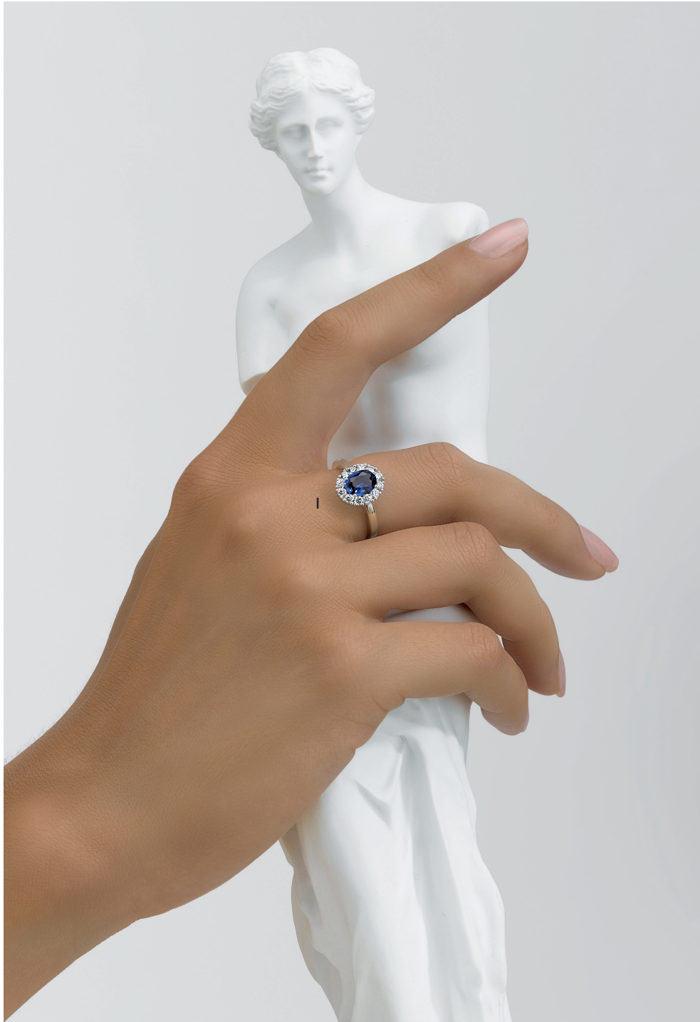
I. Bague - Diamants, saphir, or blanc - 5 190 €