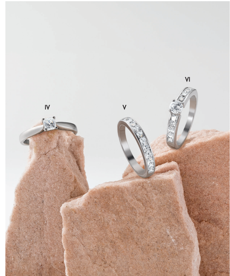
IV. Solitaire - Diamant, or blanc - 2 450 € / V. Alliance - Diamants, or blanc - 2 995 € VI. Solitaire accompagné - Diamants, or blanc- 5 395 €