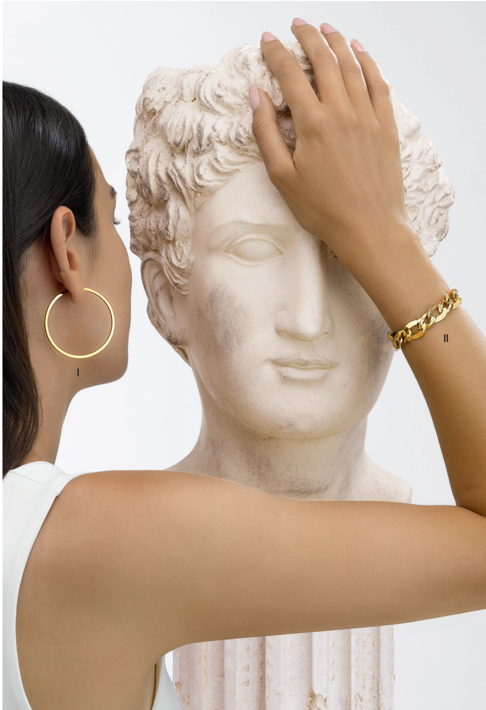
I. Créoles - Or jaune - 795 € / II. Bracelet - Or jaune, or blanc- 2 295 €