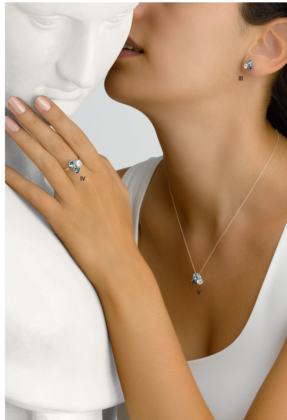
III. Boucles d'oreilles - Topaze bleue, topaze blue London, calcédoine, or blanc - 1 075 € IV. Bague - Topaze bleue, topaze blue London, calcédoine, or blanc - 1 060 € V. Collier - Topaze bleue, topaze blue London, calcédoine, or blanc - 995 €