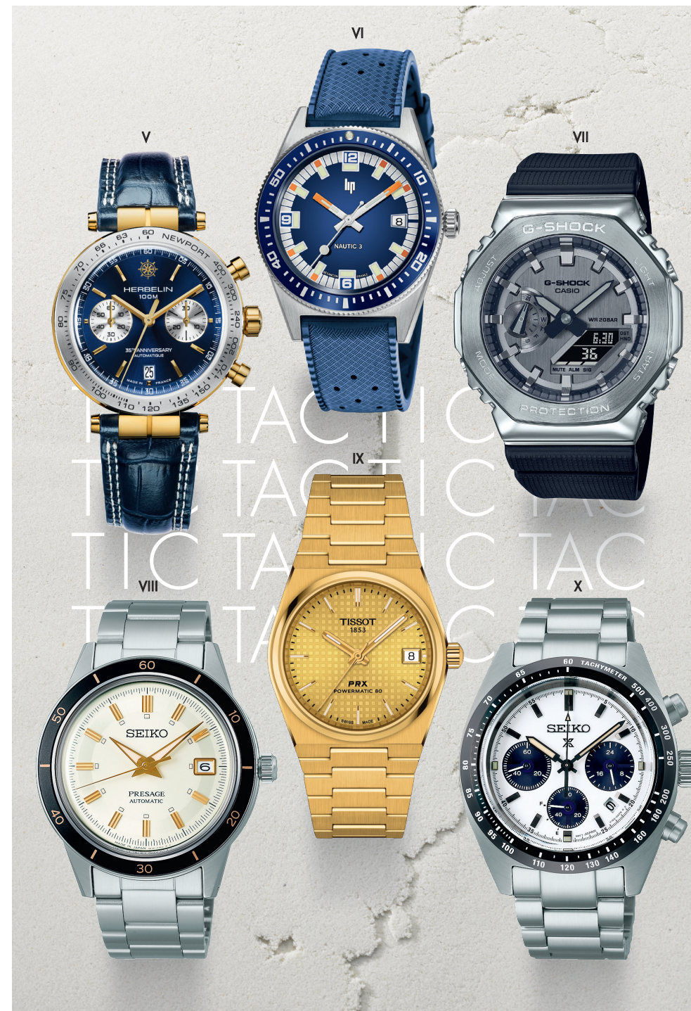
Herbelin V. Montre - Boitier acier, bracelet cuir - 2 799 € / Lip VI. Montre - Boitier acier, bracelet caoutchouc - 1 099 € Casio VII. Montre - Boitier acier, bracelet caoutchouc - 199 € / Seiko Presage VIII. Montre - Acier - 540 € / Tissot IX. Montre - Acier - 895 € Seiko X. Montre - Acier - 680 €